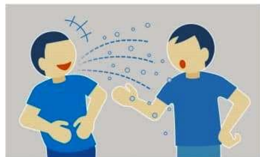
症状がなくてもウイルスを広げる