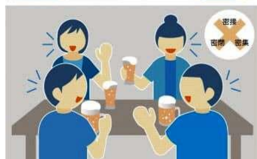
3密を避ければ感染防げる