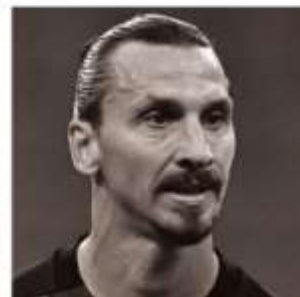
ズラタン・イブラヒモビッチ (ACミラン)