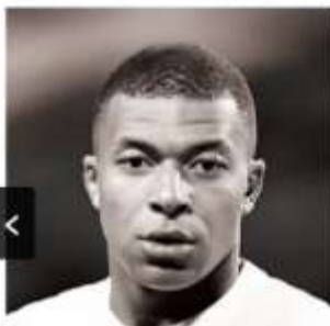
キリアン・エムバペ (PSG)