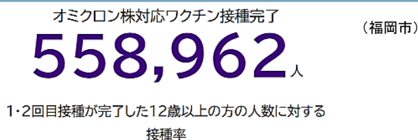
オミクロン株対応ワクチンの接種状況 (表)