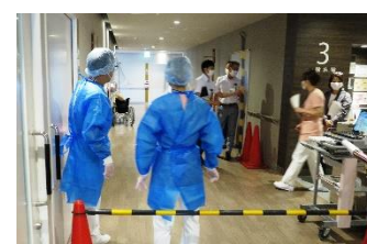
病棟の様子 防護服を着用しての業務